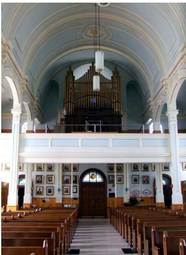
Vue arrière dans l'église Saint-François-Xavier

À l'arrière, on note la présence des portraits de tous les curés de Petite-Rivière-Saint-François, de même qu'au-dessus des portes d'entrée, de superbes vitraux aux multiples motifs.