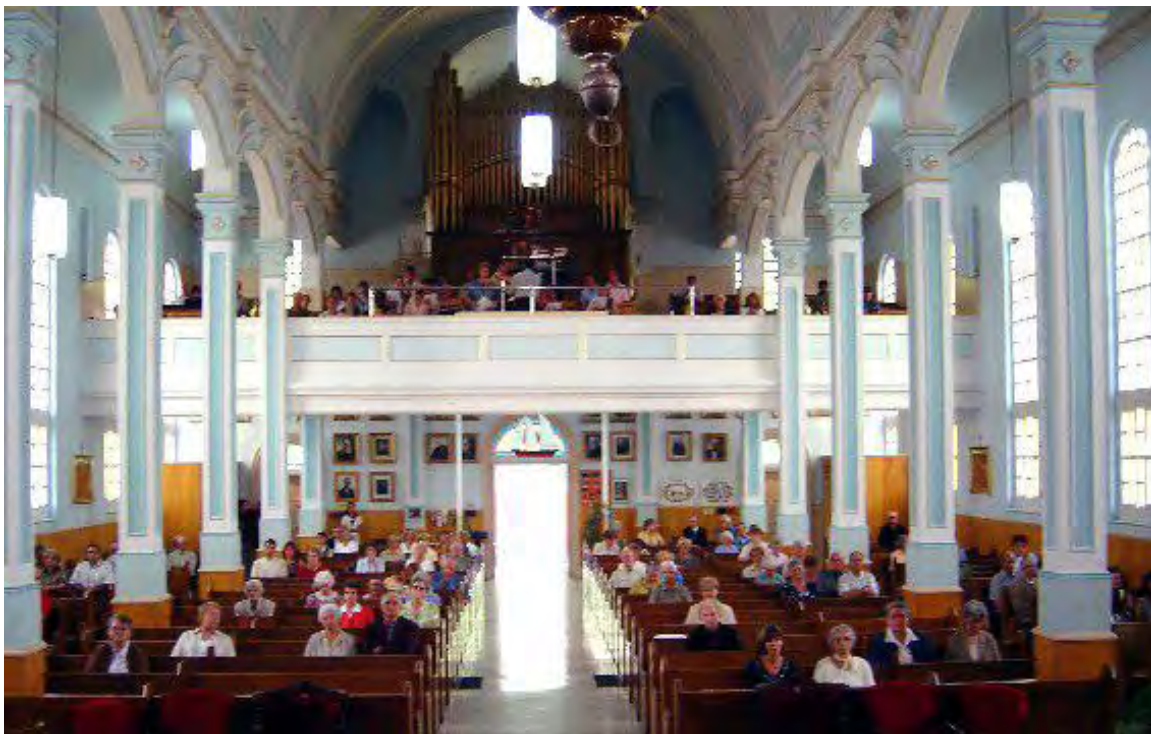
L'intérieur de l'église Saint-François-Xavier