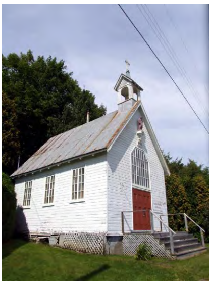
La chapelle de Grande-Pointe dédiée à Saint Joseph (gauche) et la chapelle de Maillard (droite)